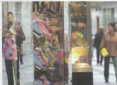
Imagen de uno de los comercios de la zona centro de Madrid.

Madrid a 28 de Febrero de 2007. La Liquidadora,